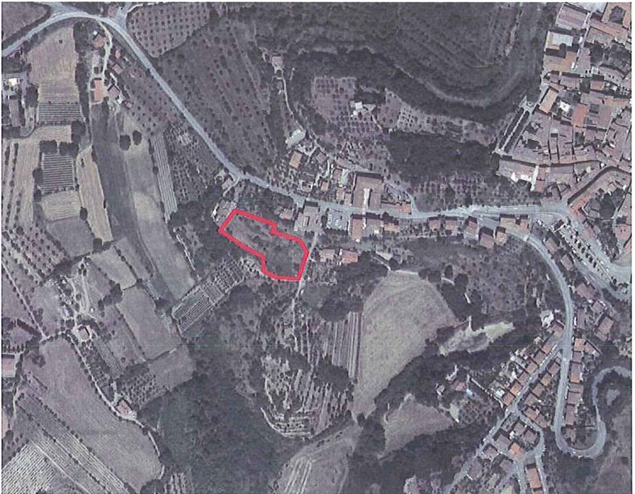
Ediltoscumbra foglio 56 p.lla 53