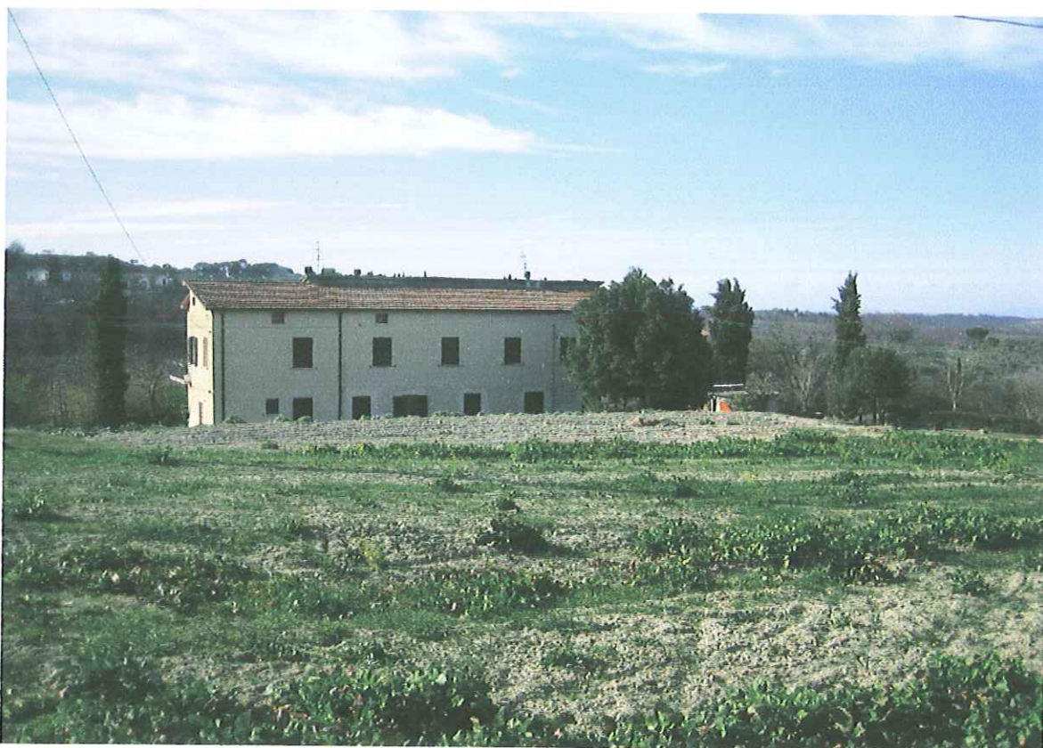
FOTO N. 2: Particolare dell'ultimo fabbricato inserito nell'UTOE n. 8 che confina, sul lato destro con il lotto oggetto dell'osservazione.