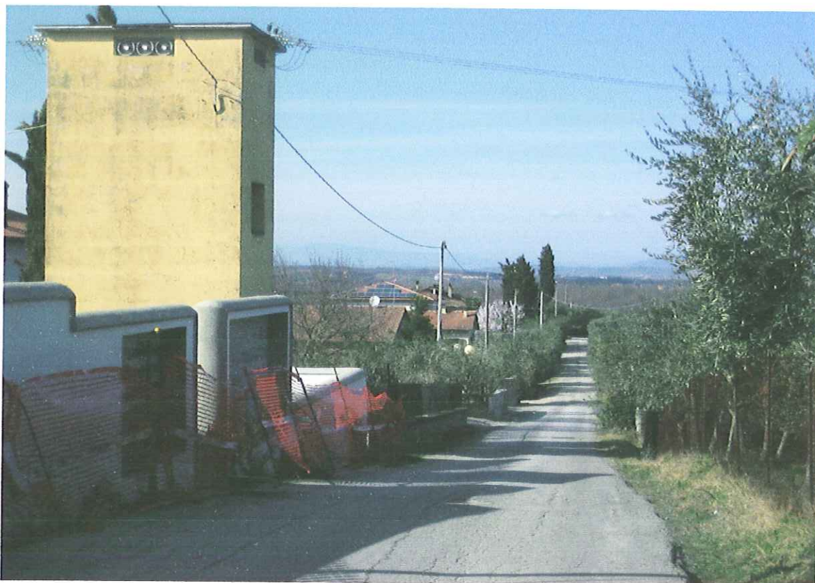
FOTO N. 1: Particolare di via San Gregorio, i fabbricati prospicienti situati prima del lotto di terreno oggetto dell'osservazione.