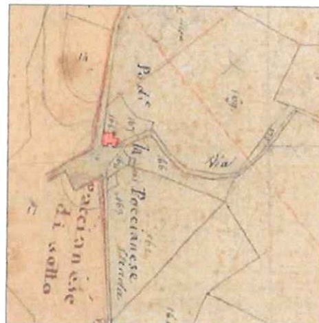
Catasto Leopoldino 1830 o Carta Tecnica Regionale

Analisi cartografie storiche: presente nel 1830